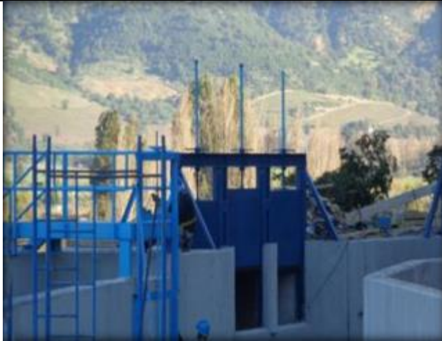
Compuertas descarga a sifón.