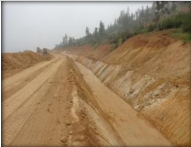
Sello de canal para hormigonado de radier, Km 5,240.