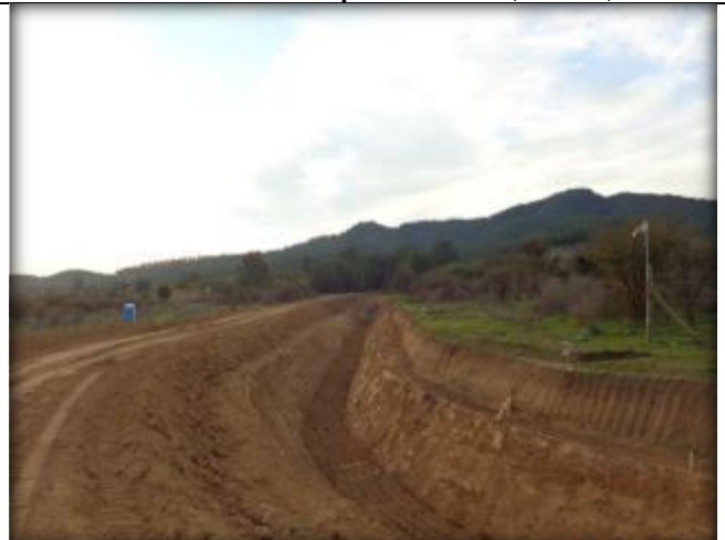
Corte de canal, Km 45,460.