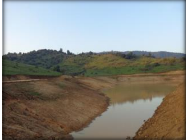
Movimiento de tierras.