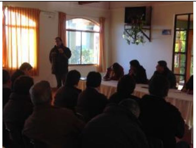
Prodesal plantea sus inquietudes.