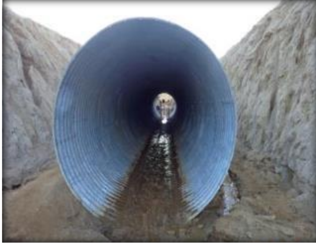
Corte en terreno, Km 21,000.