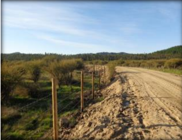
Instalación de cerco, Km 42,300.