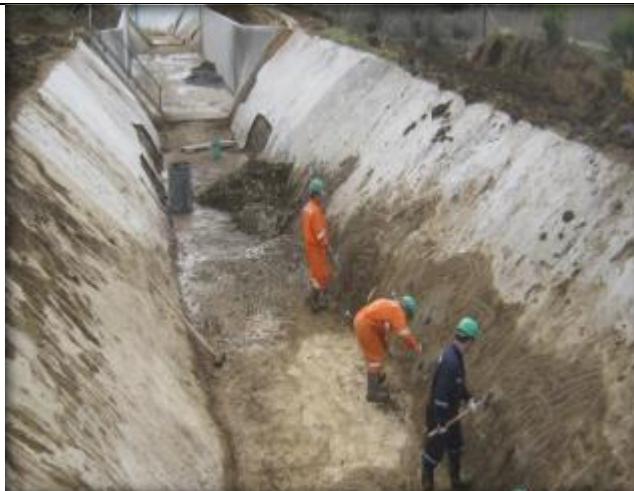
Limpieza y reparación de canal, Km (8,640 – 12,190).