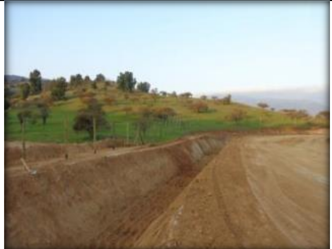
Corte de canal, Km 22,320.