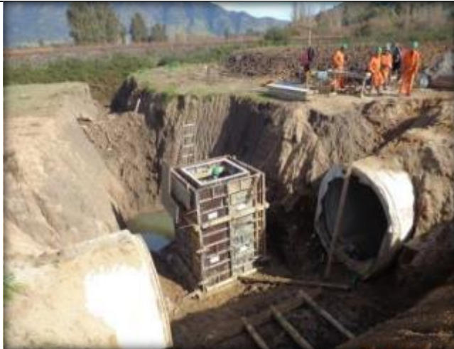
Moldaje para desagüe N°2, Km 0,300.