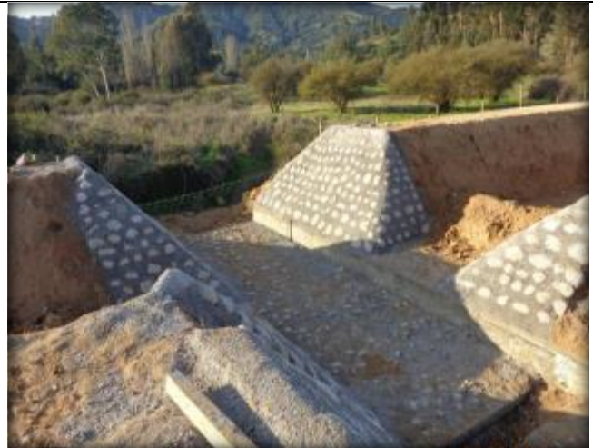
Mampostería, cruce de quebrada CQ7, Km 27,640.