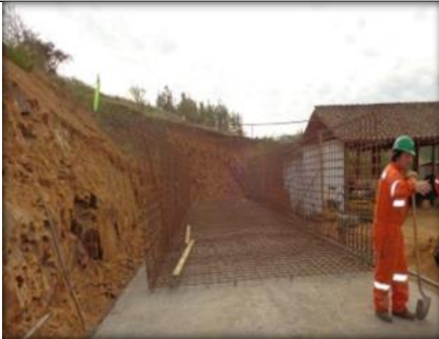
Armadura, hormigonado de canal, Km 4,420.