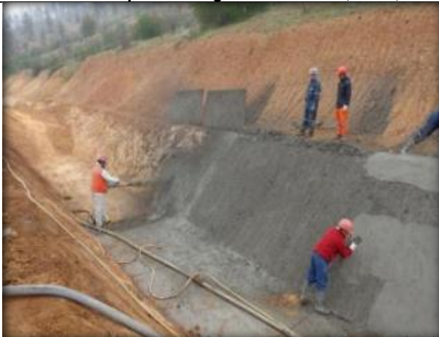
Hormigonado de canal, Km 0,5120.