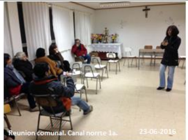
Se expone sobre medidas de manejo ambiental para la flora y fauna, pantallas acústicas.