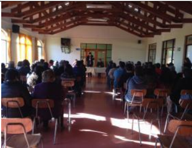
Alcalde expone tema a la comunidad.