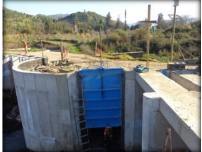
Bocatoma, compuertas de canal de descarga y alimentación.