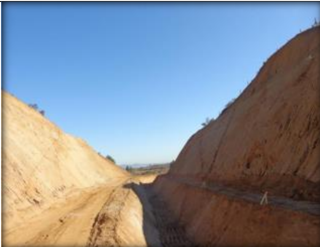
Corte de canal, Km 35,580.