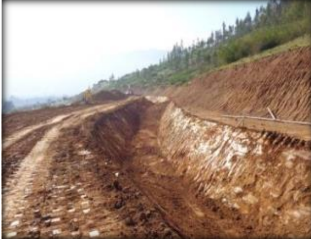
Corte de canal, Km 5,360.