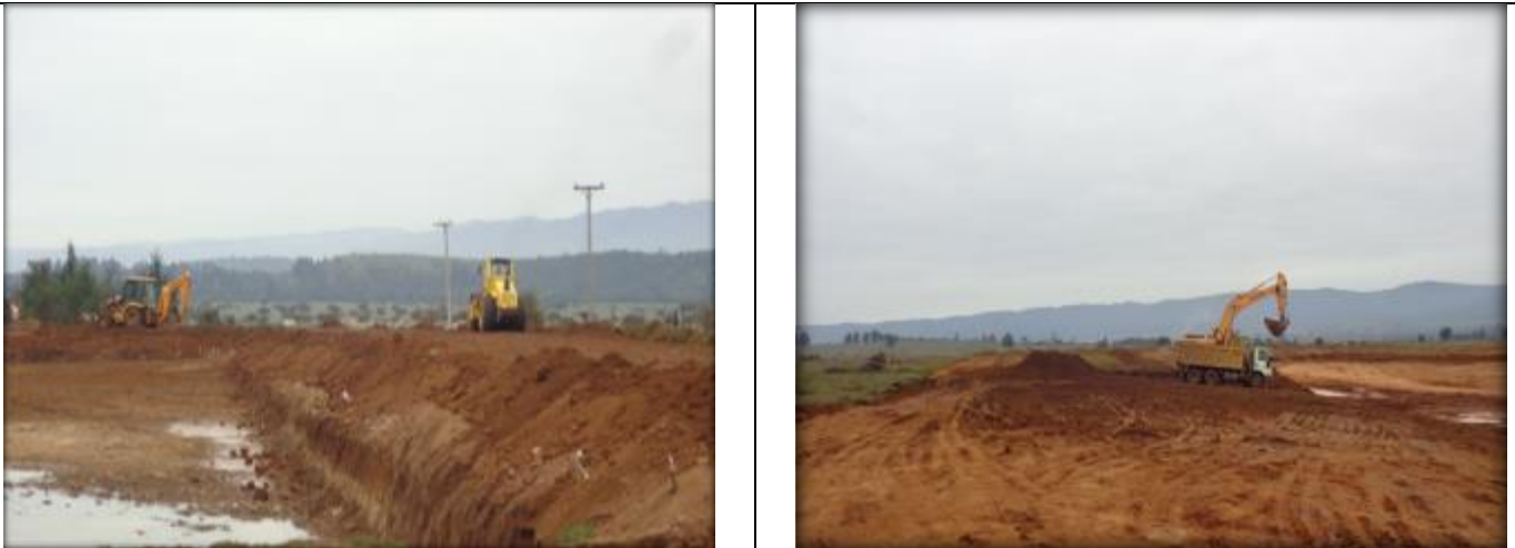
Movimiento de tierras.