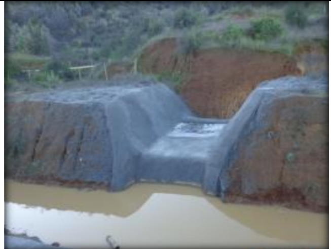
Mini descargas y descarga Tipo 1 (km 16,000 – 24,000).