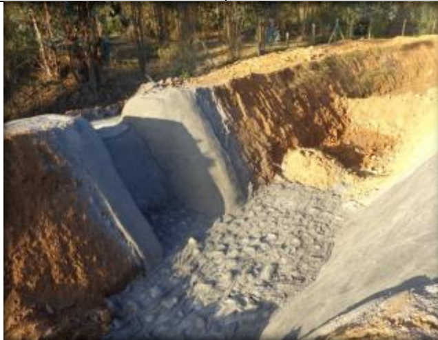
Descarga Tipo 1, Km 24,920.