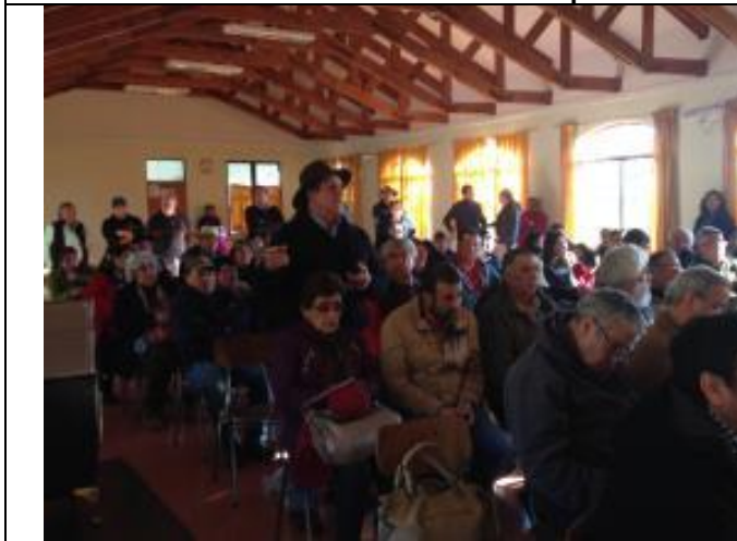
Particulares plantean sus inquietudes.