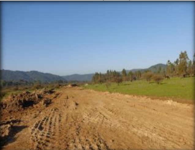
Plataforma para corte de canal, Km 44,100.