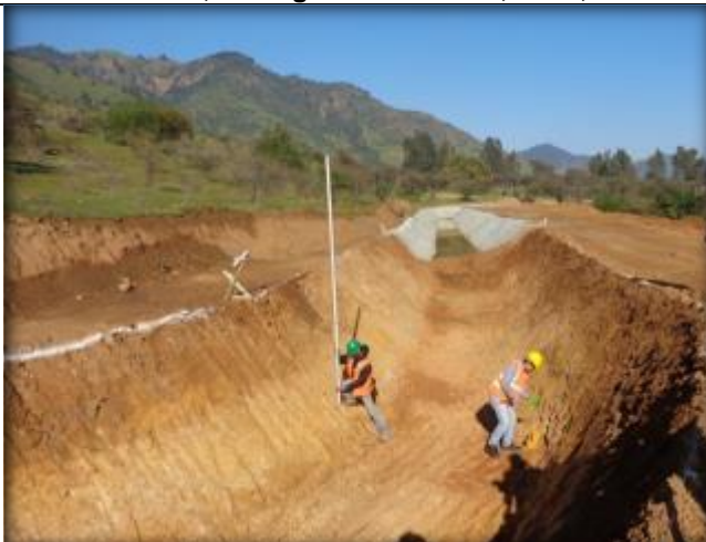
Control de sello, Km 5,340.