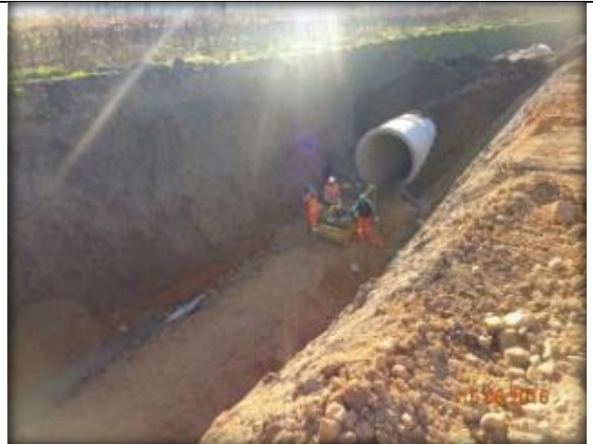
Sello de fundación para tubo prefabricado, Km 0,860.