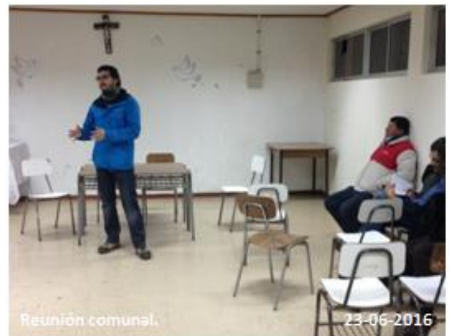
Se expone sobre medidas de prevención de riesgos.