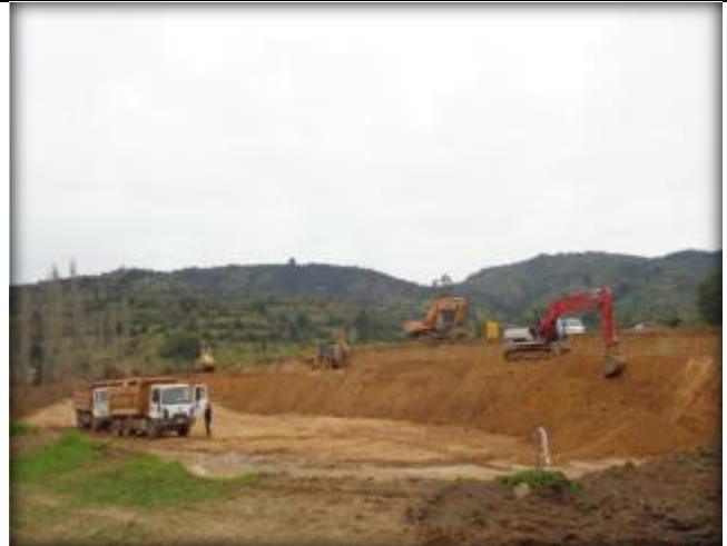
Movimiento de tierras.