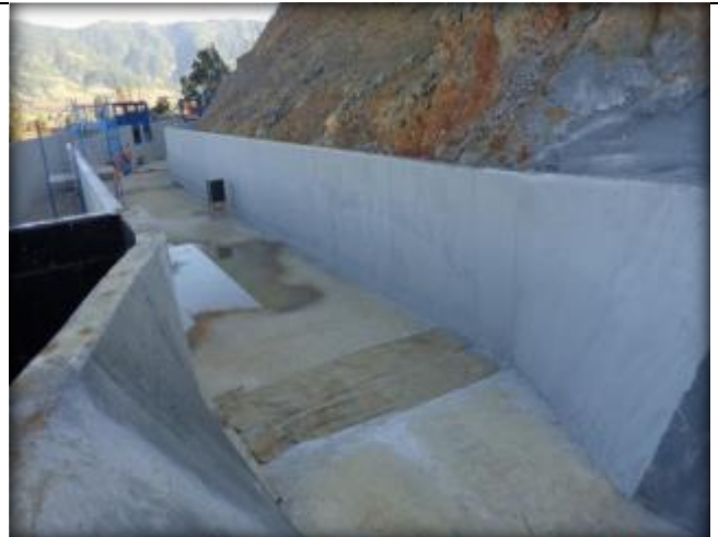
Obra de entrega a Sifón.