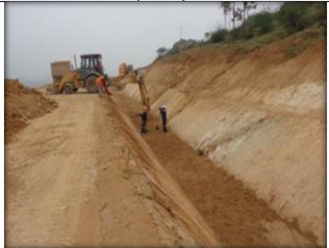
Preparación de sello para radier de canal, Km 5,100.