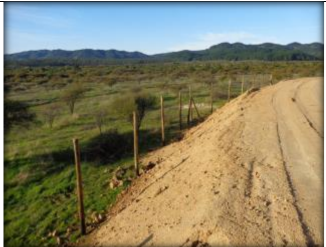
Instalación de cerco, Km 40,720.