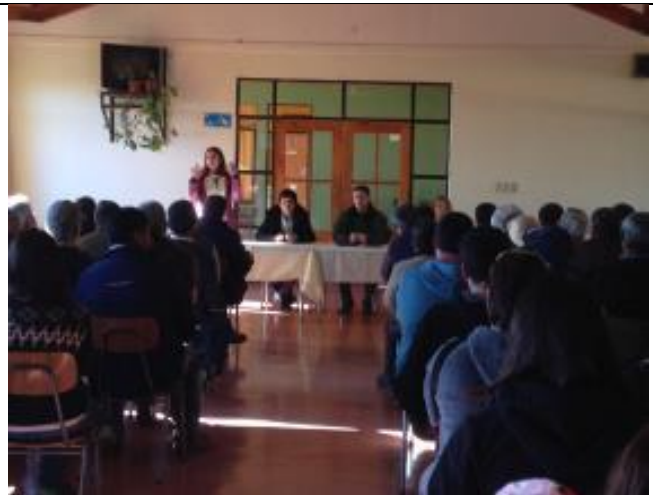
Gobernadora manifiesta su preocupación por la comunidad.