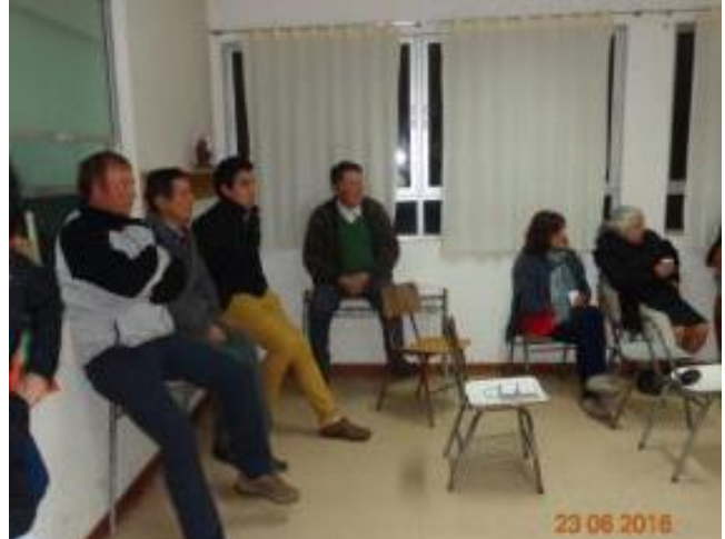
Se expone sobre el proyecto en general, aspectos técnicos.