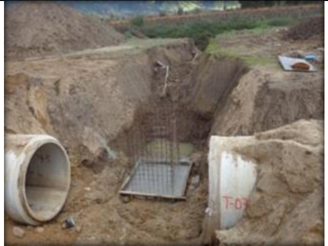
Armadura para desagüe N°2, Km 0,300.