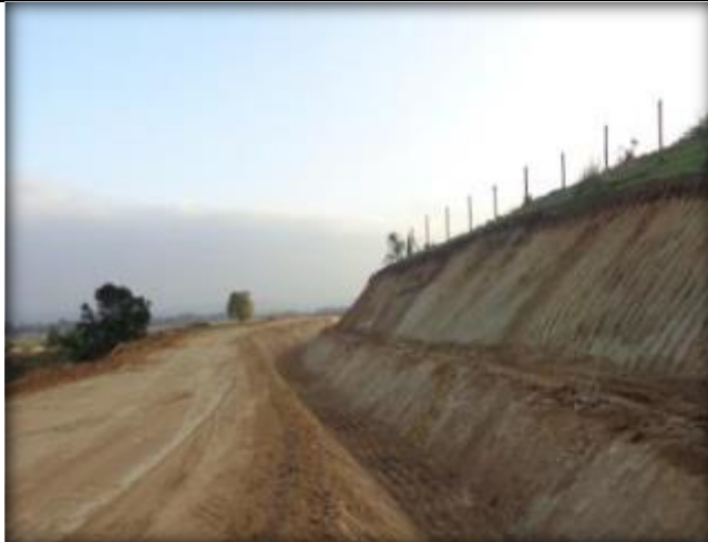
Corte de canal, Km 22,260.