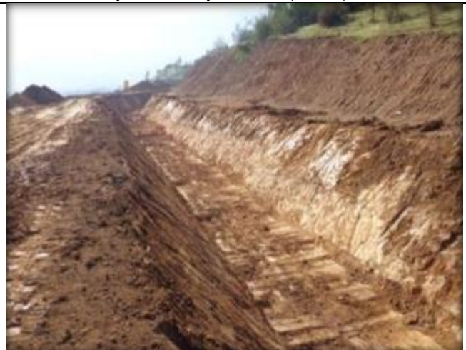
Corte de canal, Km 5,380.