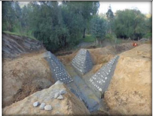
Mampostería cruce de quebrada CQ7, Km 22,780.