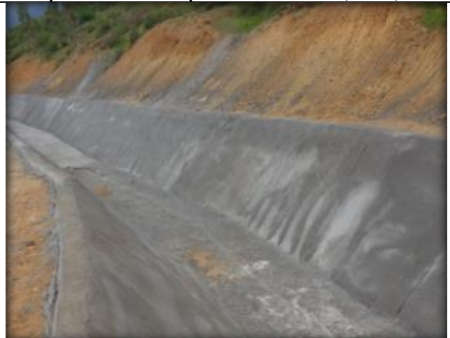
Hormigonado de canal, Km 5,220.