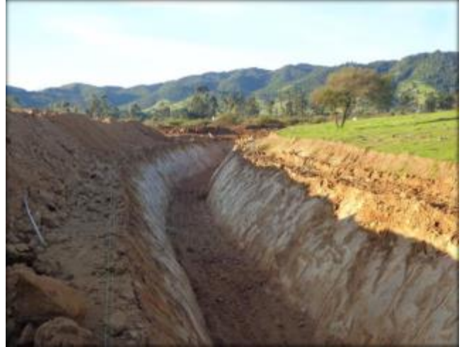
Corte de canal, Km 43,900.