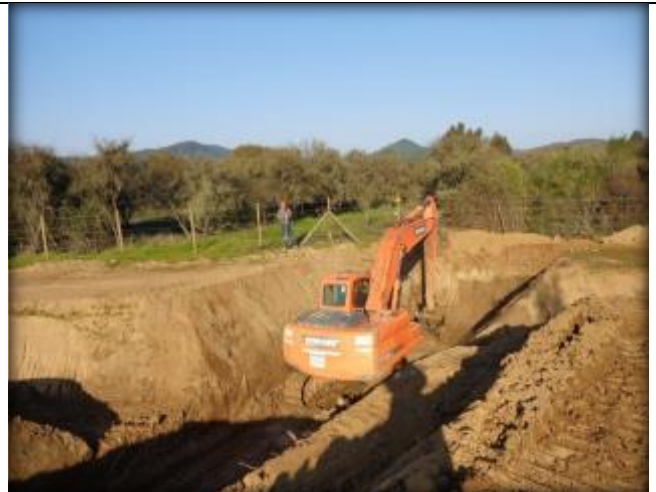
Excavación cruce de quebrada CQ7, Km 41,260.