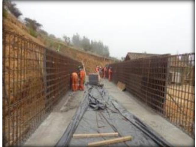
Armadura y moldaje, Km 4,420.