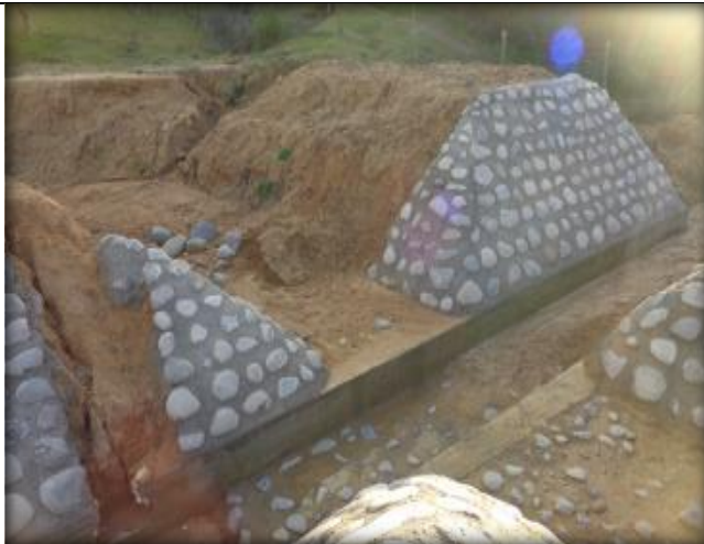
Cruce de quebrada CQ7, Km 30,400.