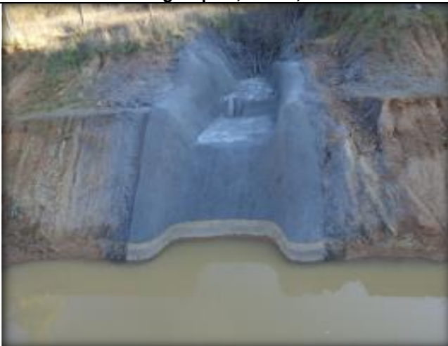
Mini descargas y descarga Tipo 1 (km 16,000 – 24,000).