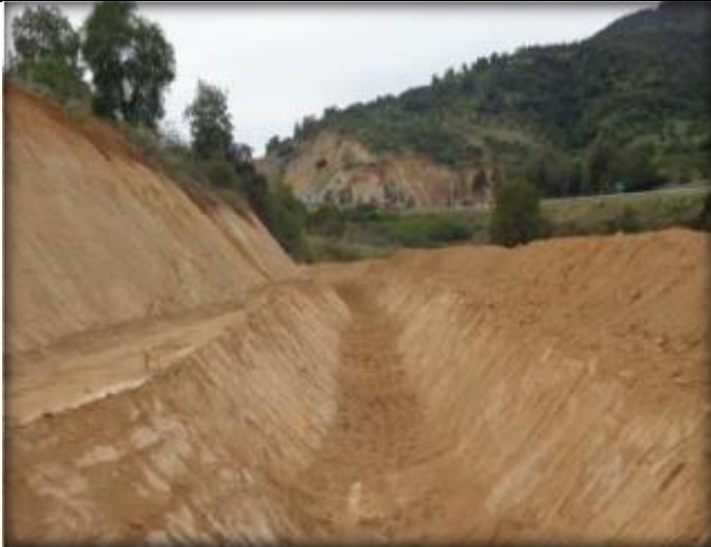
Corte de canal, Km 23,540.