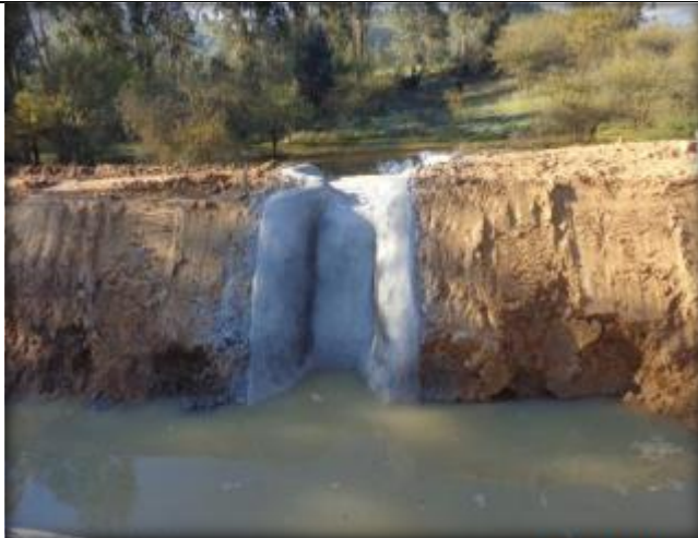
Descarga, Km 27,240.