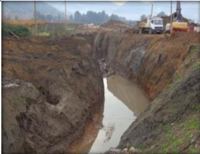
Excavación para sello de fundación curva N°5, Km 0,900.