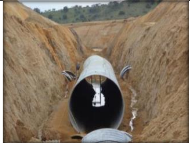
Armado de tubo corrugado, Km 21,060.