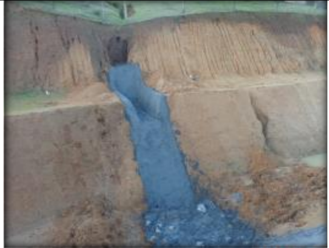
Mini descargas y descarga Tipo 1 (km 16,000 – 24,000).