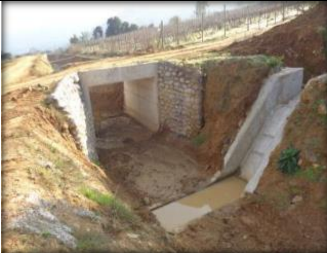
Descarga Tipo 1, Km 15,990.