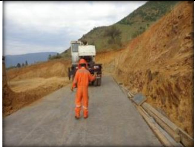
Emplantillado para canal, Km 4,420.