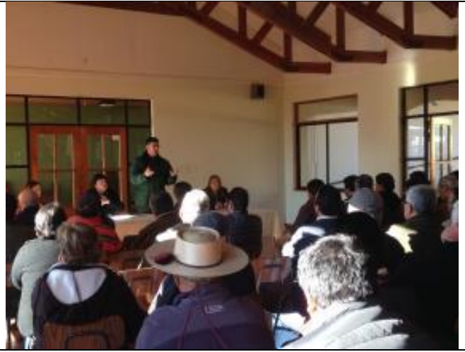
Inspector Fiscal explica a la comunidad.