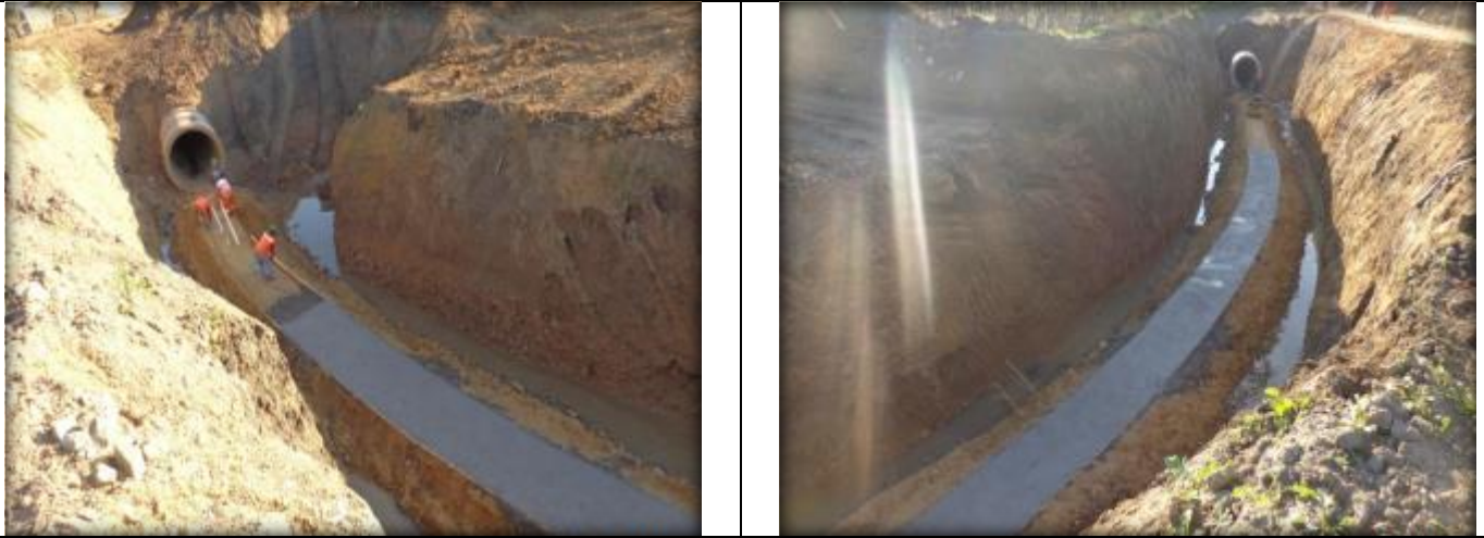
Emplantillado de curva N°5, Km 0,900.