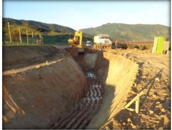
Corte en terreno, Km 28,840.